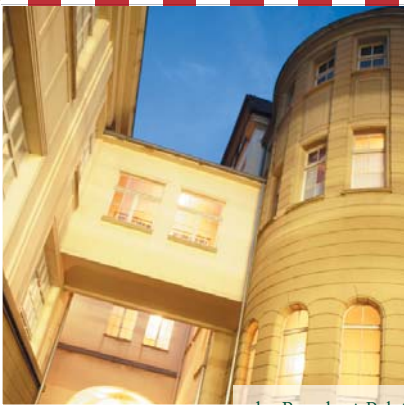
das Batschari-Palais vor der Sanierung